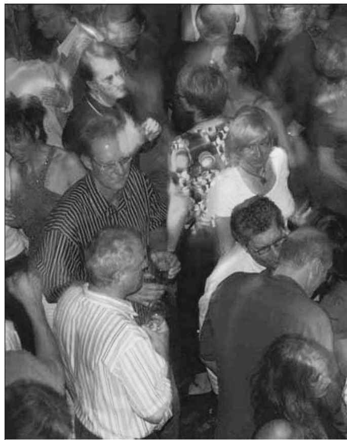
Garantiert „jugendfreier“ Freitag in der Zeche: Nach dem großen Erfolg der Ü40-Party, gibt es am Freitag, 18. Januar, die Premiere der Ü30.

In der zweiten Area gibt es den Sound der „Pop & Wave“, der erfolgreichen 80er Party vom jeweils ersten Freitag des Monats.